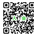
会員登録フォーム

●右記のQRコードを読み取り、【会員登録】に必要事項を入力、送信をしてください。